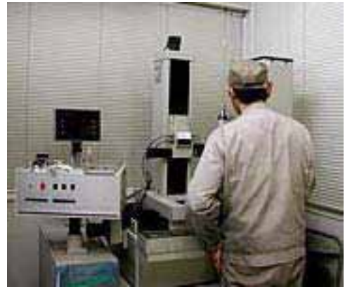
品質をリザーブする三次元測定器

一見複雑に見えるヤマテックの品質管理システムは、実は最もシンプルであり、高い信頼性に裏打ちされた実績を伴うものです。大切なことは、ミスは0にはならないことを自覚し、限りなくゼロに近づける努力を怠らぬこと。そして、同じミスを繰り返さないシステムの整備とISOに見られる意識・意志が、ヤマテックの技術力を支えています。